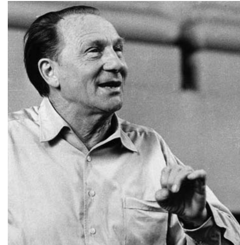
Bei einer Aufnahme im Plenarsaal der Akademie, 1964

voice and a good mood. And he trots through what is for him a decidedly cheerful programme with an ease that is often lacking in his sterile late studio recordings. He dispenses with many of his early hits (like »Baumwollpflücker«, »Säckeschmeisser« and »Nigger Jim«), concentrating instead on his two favourite poets: of the 24 songs, five are by Brecht and ten are by Tucholsky (whose »Revolutionsrückblick« has been omitted from the CD for technical reasons). Eisler, his favourite composer, is constantly present – he wrote the music for almost all the songs Busch performs this evening. Only three of the settings are not by his »old accompanist Hanns«, as Eisler dubs himself on a sheet of music dedicated to his friend. Busch has recently presented his composer with a great challenge, swamping him with more than two dozen »Tucho« texts selected