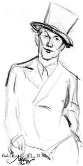
Ernst Busch singt Tucholskys »Anna Luise« im Berliner Kabarett »Katakombe« 1930

Ernst Busch sings Tucholsky's »Anna Luise« in the Berliner cabaret »Katakombe« in 1930